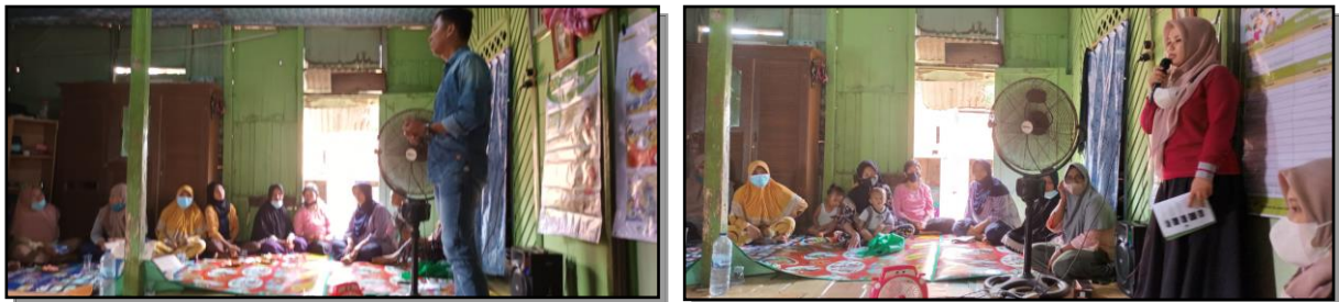
Gambar 3. Petugas Dinas Sosial Memberikan Pelatihan kepada peserta PKH