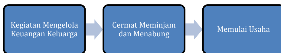
Gambar 2. Alur Pelaksanaan Kegiatan