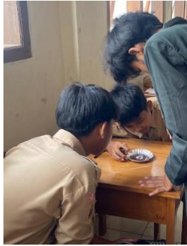
Gambar 2. Praktik Deteksi Sederhana Kandungan Yodium

Pada tahap penerapan teknologi sederhana, siswa mempraktikkan pengujian kualitas garam dapur menggunakan larutan penguji yodium (Gambar 2). Tahap ini dimulai dengan meletakkan sampel garam sebanyak setengah sendok teh, kemudian ditetesi cairan uji yodium sebanyak 2–3 tetes. Secara visual, siswa mengamati perubahan warna garam menjadi keunguan atau kebiruan setelah ditetesi larutan penguji, yang menandakan garam tersebut mengandung yodium sesuai persyaratan (minimal 30 ppm). Sebaliknya, apabila tidak terjadi perubahan warna, dapat disimpulkan bahwa garam tersebut tidak mengandung yodium. Hasil pengujian menunjukkan bahwa seluruh sampel garam positif mengandung yodium. Antusiasme peserta terlihat besar karena mereka dapat menguji langsung sampel garam yang beredar di pasaran. Hasil uji yodium dapat dilihat pada Gambar 3.