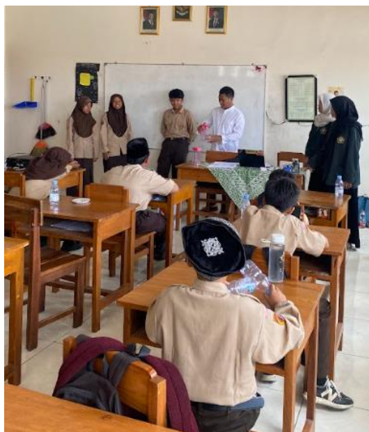
Gambar 1. Edukasi Kesehatan Gizi mengenai Yodium

Kegiatan pengabdian masyarakat pada siswa MA Asshodiqiyah berhasil dilaksanakan melalui edukasi kesehatan yang menekankan pentingnya pemenuhan zat gizi mikro untuk mendukung tumbuh kembang remaja (Gambar 1). Materi yang disampaikan berfokus pada peran yodium dalam pembentukan hormon tiroid, metabolisme tubuh, serta dampaknya terhadap perkembangan kognitif dan prestasi belajar. Selama sesi edukasi, siswa menunjukkan ketertarikan yang tinggi, terutama saat materi dikaitkan dengan dampak nyata kekurangan yodium seperti penyakit gondok dan penurunan kecerdasan. Pemaparan ini juga disisipkan nilai-nilai pentingnya menjaga kesehatan fisik sebagai bagian dari amanah, sehingga siswa memiliki kesadaran moral untuk memilih bahan pangan yang berkualitas.