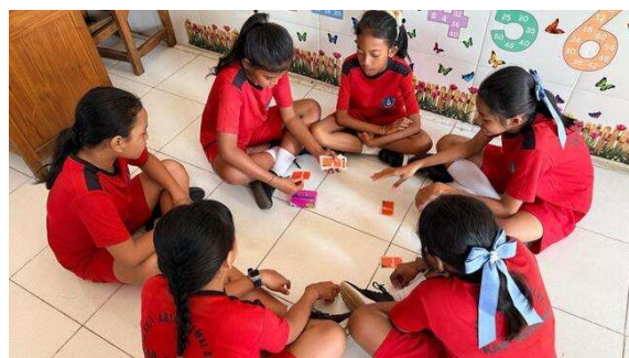
Gambar 4. Sesi Permainan Kartu "Ceritain Dong!"