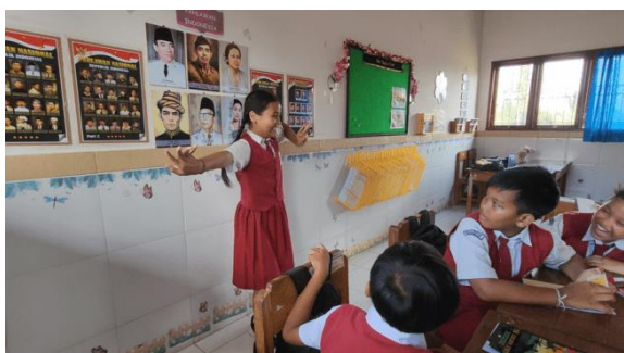
Gambar 3. Melakukan Tantangan Kartu

Pada awal kegiatan, siswa tampak malu dan belum aktif, namun tidak ditemukan resistensi yang berarti sehingga program berjalan kondusif. Seiring berjalannya kegiatan, antusiasme dan partisipasi siswa meningkat secara bertahap — terutama saat permainan kartu dimulai. Kartu yang berisi pertanyaan dan tantangan mampu mendorong siswa berinteraksi aktif tanpa rasa takut atau terbebani. Strategi pemilihan kartu secara acak mendorong keterlibatan yang lebih merata dan meningkatkan motivasi siswa secara organik. Meski hasil statistik belum menunjukkan perbedaan yang signifikan, observasi mencatat perubahan perilaku yang nyata: siswa yang sebelumnya pasif mulai berani angkat bicara.