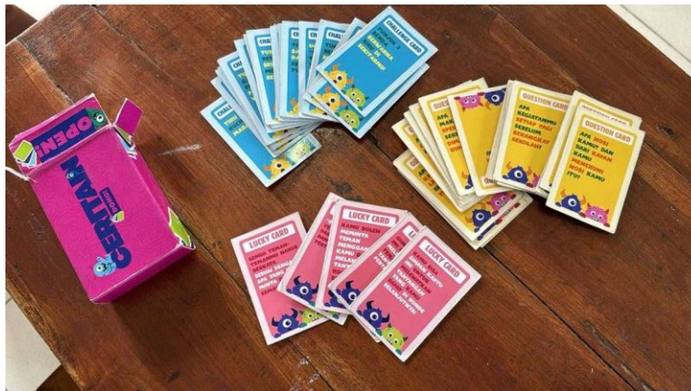
Gambar 2. Media Interaktif Kartu "Ceritain Dong!".

Evaluasi menggunakan dua metode yang dikombinasikan secara cermat. Untuk data kuantitatif, perbandingan skor pre-test dan post-test dianalisis menggunakan skala Likert guna mengukur perbedaan tingkat kepercayaan diri dan keberanian tampil siswa sebelum dan sesudah intervensi. Instrumen terdiri dari 12 item pernyataan yang mengukur tiga indikator: (1) keberanian tampil, (2) kepercayaan diri, dan (3) kelancaran bicara. Untuk data kualitatif, evaluasi dilakukan melalui triangulasi sumber — membandingkan data dari siswa dan guru — serta triangulasi metode yang membandingkan hasil observasi, refleksi siswa, dan wawancara guru. Analisis data mengikuti tiga tahapan: pemilahan data, pemaparan data, dan pengambilan kesimpulan, dengan temuan yang diorganisasikan ke dalam tiga tema pokok: keberanian tampil, partisipasi aktif, dan perubahan sikap siswa. Keabsahan data dijaga melalui diskusi antar-pengamat untuk menyamakan persepsi terhadap hasil observasi serta klarifikasi temuan kepada guru kelas. Interpretasi hasil dilakukan secara hati-hati dengan mempertimbangkan konteks kegiatan dan karakteristik subjek, sehingga tidak dilakukan generalisasi yang melampaui batas data. Seluruh kegiatan dilaksanakan dengan persetujuan pihak sekolah serta memperhatikan prinsip etika, khususnya terkait kerahasiaan identitas siswa dan penggunaan data hanya untuk kepentingan akademik.