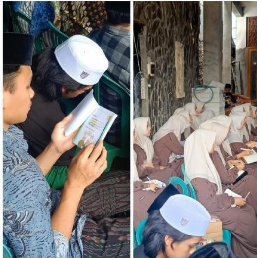
Gambar 3. Modul Santripreneurship yang dipelajari oleh para santri

Setelah pembukaan, santri menerima modul Santripreneurship sebagai bahan pembelajaran. Sesi dilanjutkan dengan penyampaian materi mengenai konsep dasar, pengembangan, dan manfaat kewirausahaan, disertai contoh nyata keberhasilan santri dalam mengembangkan usaha di lingkungan pesantren. Kegiatan berlangsung secara interaktif melalui sesi diskusi dan kuis singkat yang mendorong antusiasme serta motivasi santri untuk memahami dan menerapkan prinsip-prinsip kewirausahaan.