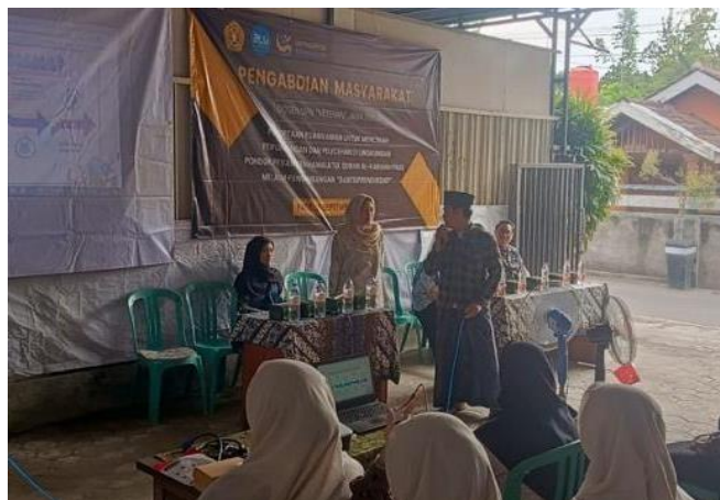
Gambar 6. Sesi Presentasi

tren yang memengaruhi rancangan bisnis, sehingga usaha dapat dikelola secara lebih terstruktur dan responsif terhadap kebutuhan pasar (Hendrasto et al. , 2024). Santri diajak mengidentifikasi sembilan elemen utama BMC dan menerapkannya pada ide usaha masing-masing kelompok. Hasil FGD menunjukkan bahwa santri mampu merumuskan ide bisnis yang realistis dan kontekstual, antara lain: (1) usaha jus sehat dan herbal dengan memanfaatkan hasil pertanian lokal; (2) jasa penyewaan sepeda untuk pelajar dan wisatawan di kawasan Kampung Inggris; serta (3) produksi makanan ringan khas pesantren. Ide-ide tersebut mencerminkan kemampuan santri untuk berpikir kreatif, kolaboratif, dan analitis terhadap potensi lingkungan sekitar. Penerapan BMC dalam pendidikan kewirausahaan terbukti meningkatkan kualitas model bisnis peserta dan kesiapan mereka untuk melanjutkan ke tahap pelaksanaan (Sa'adi et al. , 2025).