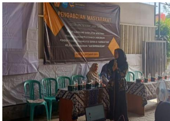
Gambar 5. Sosialisasi

Sebelum kegiatan dilaksanakan, sebagian besar santri belum memahami perbedaan antara berdagang secara tradisional dengan konsep entrepreneurship yang mencakup inovasi, perencanaan, serta pengelolaan usaha yang berkelanjutan. Melalui sesi sosialisasi dan penyampaian materi dasar, santri mulai memahami elemen-elemen penting kewirausahaan, seperti peluang bisnis, strategi pemasaran, serta manajemen modal sederhana yang sesuai dengan prinsip syariah. Pemberdayaan santri melalui kewirausahaan terbukti dapat meningkatkan kesiapan mereka dalam mencapai kemandirian ekonomi pesantren. Pesantren yang mengembangkan unit usaha santri dapat mencatat peningkatan kompetensi ekonomi secara nyata (Sholehudin & Nurman, 2025). Hal ini menunjukkan bahwa pendidikan kewirausahaan di lingkungan pesantren perlu diimbangi dengan strategi kelembagaan yang kuat, mencakup dukungan manajerial, penguatan kurikulum berbasis praktik, serta kolaborasi eksternal, agar usaha dapat berjalan berkelanjutan dan memberikan dampak ekonomi yang berarti bagi pesantren dan masyarakat sekitar (Nurdiansyah & Veri, 2025).