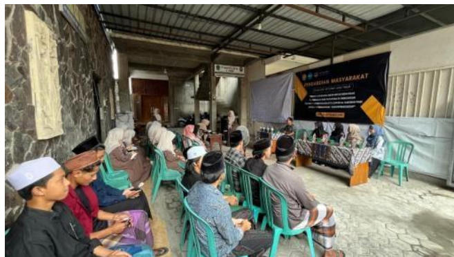
Gambar 2. Acara Sosialisasi Santripreneurship

Kegiatan sosialisasi dilaksanakan pada September 2025 dan diikuti oleh sekitar 25 santri serta 3 orang pengasuh pondok. Acara dibuka dengan sambutan dari Kepala Pengelola Pondok Pesantren Hamalatul Quran Al-Karimah, dilanjutkan sambutan dari perwakilan tim Pengabdian Masyarakat.