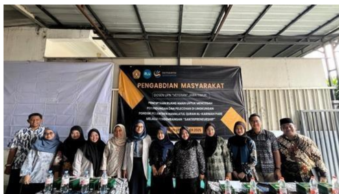
Gambar 4. Pondok Pesantren Hamalatul Quran Al-Karimah

Kegiatan " Santripreneurship: Model Kemandirian Ekonomi Berbasis Pesantren di Era Digital " yang dilaksanakan di Pondok Pesantren Hamalatul Quran Al-Karimah, Pare, Kediri, Jawa Timur, menghasilkan sejumlah capaian yang menunjukkan peningkatan pengetahuan, keterampilan, dan kesadaran kewirausahaan di kalangan santri.