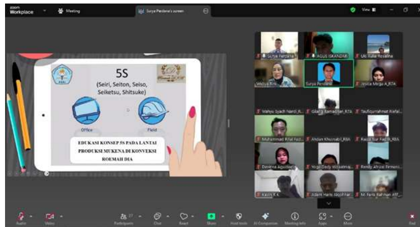
Gambar 1. Penyampaian materi 5S melalui aplikasi zoom

Tahap awal kegiatan pengabdian kepada masyarakat ini yaitu dengan dilakukan observasi offline kepada pemilik usaha, dimana saat melakukan observasi ditemukan kendala pada cara kerja yang tidak rapih dan ringkas dalam melaksanakan proses produksinya. Setelah melakukan observasi dan wawancara, kami melakukan kegiatan sosialisasi yang dilakukan pada hari Minggu, 14 Juli 2025 pukul 19.00 WIB menggunakan aplikasi Zoom Meeting. Pada kegiatan sosialisasi tersebut, Tim PkM melakukan sosialisasi berupa penyampaian pengertian, konsep, dan implementasi 5S. Setelah itu dilakukan pendampingan terkait implementasi dari 5S, para pihak dari Perusahaan sangat aktif menanyakan bagaimana penggunaan 5S dapat membantu Perusahaan dalam menganalisis aspek-aspek kunci dari layout proses produksi mereka. Berikut dokumentasi sosialisasi ke mitra: