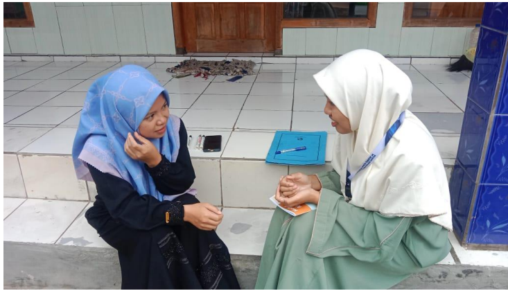
Gambar 4. Wawancara dengan Guru Bahasa Arab