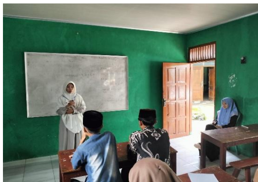
Gambar 2. Implementasi Modul Ajar

Pelaksanaan implementasi modul dilakukan dalam lingkungan kelas dengan menggunakan berbagai media pendukung seperti video audio-visual.