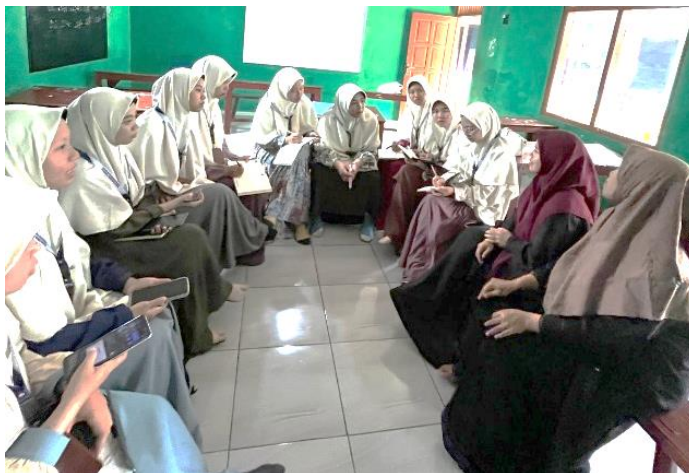
Gambar 1. Sosialisasi Dengan Guru Bahasa Arab

Tahapan ini dirancang secara sistematis untuk memastikan keberhasilan implementasi dan optimalisasi penggunaan modul ajar percakapan bahasa Arab sehari-hari. Adapun tujuan utama dari tahap ini adalah memberikan pemahaman yang menyeluruh tentang program implementasi modul ajar kepada mitra, yaitu para guru pengampu mata pelajaran bahasa Arab.