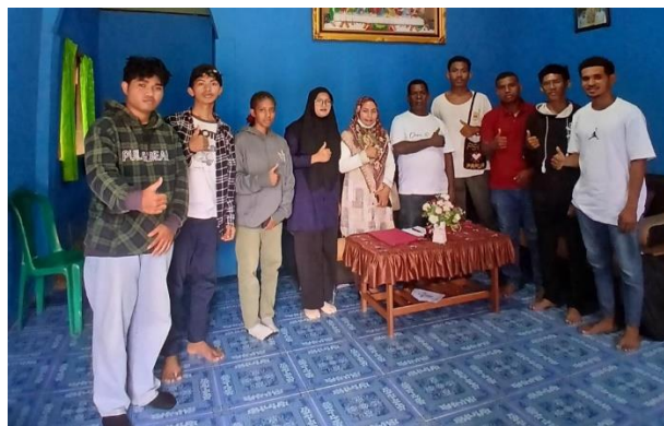
Gambar 1. Diskusi dengan Pemerintah Kampung Aimo

Kegiatan pendampingan penyusunan Rencana Pembangunan Jangka Menengah Desa (RPJMDes) di Kampung Aimo telah menghasilkan sejumlah capaian penting, baik dari aspek penyusunan dokumen perencanaan maupun peningkatan kapasitas sumber daya manusia di tingkat kampung. Salah satu hasil utama yang berhasil dicapai adalah penyusunan draf awal dokumen RPJMDes yang mencakup visi dan misi kepala kampung terpilih, arah kebijakan pembangunan, rencana kegiatan tahunan, serta indikator keberhasilan pembangunan desa untuk kurun waktu enam tahun mendatang. Proses penyusunan dokumen ini dilaksanakan secara bertahap dengan mengedepankan pendekatan partisipatif yang melibatkan berbagai elemen masyarakat. Pada tahap awal, pengumpulan data dasar dan pemetaan potensi desa dilakukan melalui diskusi kelompok terarah serta observasi langsung di lapangan. Masyarakat turut berperan aktif dalam mengidentifikasi potensi dan permasalahan yang ada di kampung mereka, yang kemudian menjadi landasan utama dalam merumuskan rencana pembangunan. Keterlibatan ini tidak hanya menghasilkan data yang relevan dengan kondisi aktual, tetapi juga meningkatkan kesadaran masyarakat akan pentingnya data sebagai dasar pengambilan keputusan dalam pembangunan yang tepat sasaran.