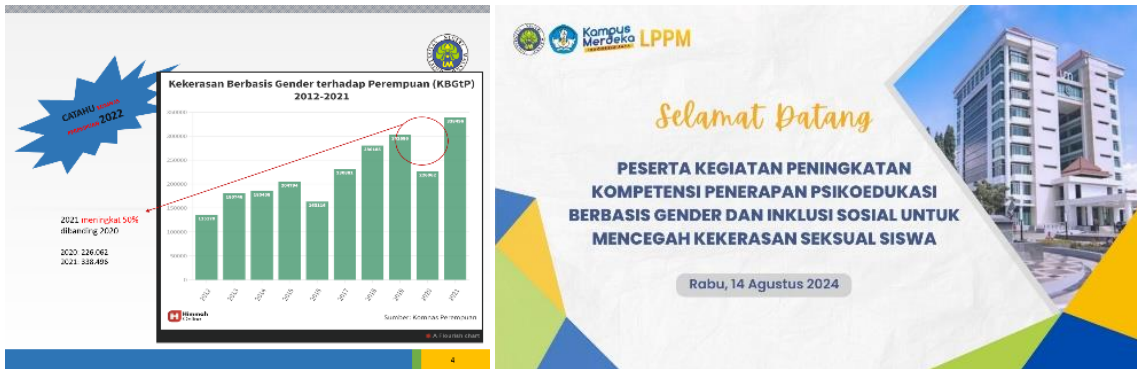
Gambar 2. Pengembangan Materi Pengabdian dan Desain Backdrop

Tahap sosialisasi, tim melaksanakan sosialisasi terkait pelatihan kompetensi psikoedukasi berbasis gender dan inklusi sosial kepada para peserta. Kegiatan dilaksanakan secara daring melalui platform Google Meeting dengan Teknik brainstorming. Adapun pokok pembahasan kegiatan ini yaitu (1) penyampaian tujuan dalam pelaksanaan pelatihan, (2) jadwal pelatihan, (3) kegiatan pelatihan, dan (4) pengisian instrumen atau pre-test . Sosialisasi diikuti oleh 19 peserta yang berasal dari perwakilan konselor MGBK MTs Kota Malang.