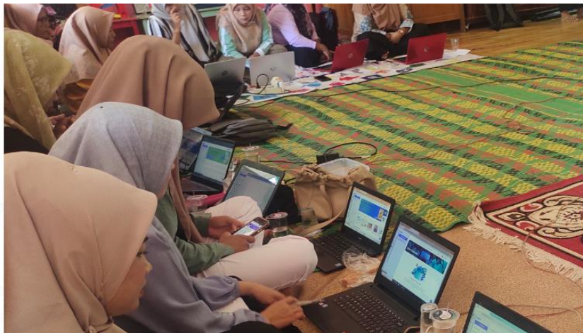
Gambar 5. Pelatihan Kepada Pengguna dan pelatihan pembuatan konten