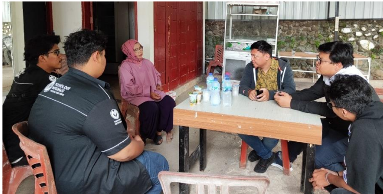
Gambar 1. Diskusi dengan Ketua Forum Pemberdayaan Nagari Terkait Kebutuhan Sistem

Pada tahap rancangan dan pembuatan sistem, proses dimulai dengan merancang struktur dan antarmuka pengguna ( user interface atau UI ) website yang akan digunakan oleh Forum Pemberdayaan Masyarakat (FPM) Limau Manis. Desain antarmuka ini disusun berdasarkan kebutuhan masyarakat yang telah diidentifikasi sebelumnya. Antarmuka mencakup elemen-elemen penting, seperti halaman utama yang menampilkan informasi wisata Puncak Labuang, katalog produk UMKM , serta halaman kontak yang mudah diakses oleh pengunjung. Struktur website dirancang dengan navigasi yang sederhana namun tetap intuitif, bertujuan untuk memudahkan pengguna dari berbagai latar belakang dalam mengakses informasi secara cepat. Selain itu, penggunaan desain yang responsif menjadi prioritas agar website dapat diakses dengan optimal melalui perangkat desktop maupun perangkat mobile , mengingat tingginya tren penggunaan perangkat mobile di kalangan masyarakat dan wisatawan.