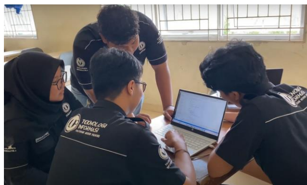
Gambar 2. Perancangan dan Pembuatan Sistem

Setelah tahap perancangan selesai, pengembangan sistem dilakukan dengan membangun fitur-fitur inti yang telah dirancang. Fitur utama mencakup halaman profil Nagari Limau Manis, informasi wisata yang dilengkapi dengan deskripsi dan foto destinasi, serta katalog produk UMKM yang diharapkan dapat memperkenalkan produk lokal kepada audiens yang lebih luas. Selama proses pengembangan, teknologi web terkini diterapkan untuk memastikan kecepatan akses dan keamanan data. Tahap ini diakhiri dengan uji coba internal terhadap website yang telah dikembangkan guna memastikan setiap fitur berfungsi dengan baik dan memenuhi harapan pengguna. Proses iterasi dilakukan pada beberapa bagian yang memerlukan penyesuaian berdasarkan hasil uji coba awal. Hasil akhir dari tahap ini adalah website yang siap untuk diuji lebih lanjut dan diimplementasikan, dengan tujuan mendukung promosi pariwisata serta produk UMKM di Limau Manis.