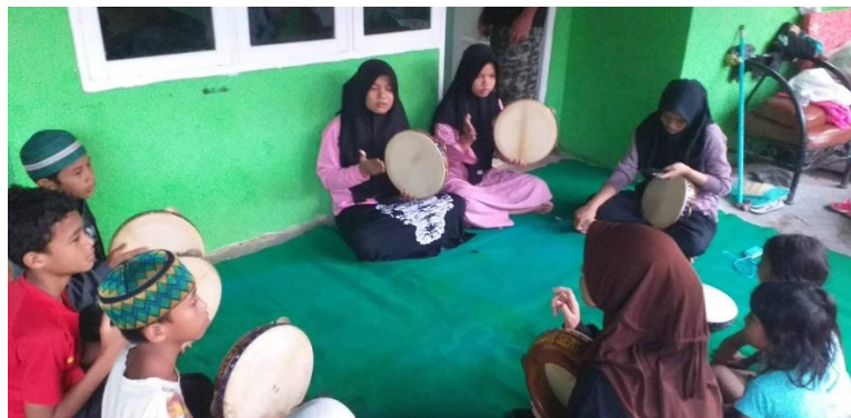
Gambar 3. Proses Pelatihan Hadroh

Di sisi lain, pemberdayaan masyarakat juga termasuk konsep pembangunan ekonomi yang berisi nilai-nilai sosial. Konsep tersebut mencerminkan cara pembangunan yang bersifat peoplecentered , participatory , empowering , dan sustainable . Mengidentifikasi proses pemberdayaan yang berkesinambungan melalui pelatihan (Silvia Maulidatus Sholikha, 2012). Pemberdayaan pemuda dalam melestarikan seni budaya hadroh merupakan upaya untuk meningkatkan kapasitas masyarakat baik secara individu maupun kelompok dalam memecahkan berbagai persoalan terkait kualitas hidup dan kesejahteraan masyarakat. Dalam prosesnya, pemberdayaan masyarakat memerlukan keterlibatan dari berbagai pihak baik pemerintah, pihak non-pemerintah, maupun masyarakat yang terlibat itu sendiri untuk dapat menjamin tercapainya hasil yang akan dituju (Hayuningtyas & Anis Restu, 2018). Para pemuda mulai dibina secara adab dan etika dengan pengembangan membaca dzikir dan sholawat sesuai dengan kaidah membaca Alquran yang baik lantunan dzikir dan sholawat tim rebana ini mampu memberikan hasil berupa juara pada beberapa event yang dilaksanakan di kota Manado tidak hanya itu saja dari pengembangan diri dan pembangunan karakter pada setiap anggota yang ada akhirnya mampu memotivasi pada komunitas yang lain di sekitar tempat berdomisili di kota Manado, yaitu menjadi pionir dan membangun sel-sel baru berupa grup rebana dan hadroh pada masjid-masjid tetangga yang lain yang berlokasi di Sanggar Seni Symphony.