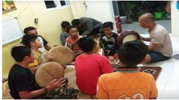
Gambar 2. Antusiasme yang tinggi Para Pemuda dalam Latihan Hadroh

modal sosial pada kelompok masyarakat melalui pemuda, untuk menjadikan mereka lebih produktif dan menghindari kebiasaan-kebiasaan yang kurang produktif (Ali Daud Hasibuan et al. , 2023).