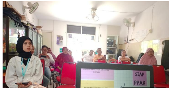
Gambar 3. Sosialisasi dan pengenalan kewarga aplikasi SIAPPAK