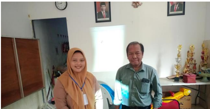
Gambar 2. koordinasi Dengan kepala Rw akan dilaksanakan sosialisasi