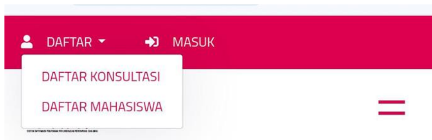
Gambar 6. Tampilan Pendaftaran Konsultasi

Dengan adanya antusiasme yang tinggi dari warga, keesokan harinya diadakan sesi pendampingan khusus bagi mereka yang ingin mendaftar dan menggunakan aplikasi. Sesi ini bertujuan untuk memberikan panduan langkah demi langkah dalam proses pendaftaran, menjelaskan fitur-fitur kunci, serta memberikan contoh penggunaan aplikasi dalam konteks nyata. Pendampingan ini membantu warga dalam mengatasi potensi hambatan atau kebingungan yang mungkin muncul selama penggunaan aplikasi. Selain itu, sesi pendampingan juga menjadi kesempatan bagi mereka untuk berbagi pengalaman dan pertanyaan langsung kepada fasilitator. Dengan adanya kegiatan ini, diharapkan masyarakat dapat dengan lebih efektif dan percaya diri memanfaatkan aplikasi SIAPPK dalam kehidupan sehari-hari mereka.