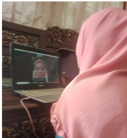
Gambar 4. Pendampingan warga konsultasi di situs Aplikasi SIAPPAK