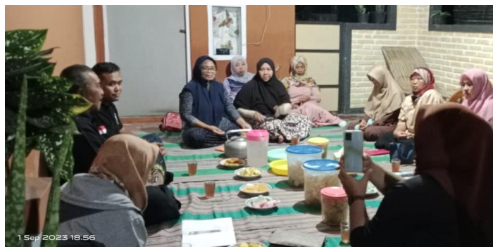
Gambar 2. Forum Group Discussion KWT Tunas Berkah

Kegiatan awal oleh tim adalah observasi dan mengumpulkan data yang diperlukan melalui wawancara dengan kelompok KWT, dengan pak Lurah, pak RW dan RT. Tim pengabdian terdiri dari 3 dosen sesuai dengan bidang masing-masing yaitu budidaya pembibitan, manajemen kebun dan marketing. Data dan informasi yang diperoleh kemudian dianalisis dan dirumuskan permasalahan. Yang dilakukan untuk memberikan solusi permasalahan yaitu dengan melaksanakan seminar dan pelatihan sesuai dengan metode yang digunakan yaitu Partisipatoris Appraisal. FGD dan Pelatihan yang dilakukan mengambil topik pengenalan metode PRA, pelatihan budidaya pembibitan, pelatihan menejemen (pengelolaan) kebun bibit dan marketing. Dalam kegiatan FGD ini, dihadiri oleh seluruh anggota kelompok KWT, Penyuluh Kecamatan Sananwetan, Ketua RT, Ketua RW dan Kepala Kelurahan Gedog dan Tim Pengabdian. Pembahasan FGD adalah diskusi mengenai pemecahan permasalahan yang dihadapi oleh kelompok KWT mengenai permasalahan pokok budidaya pembibitan, pengelolaan kebun bibit dan pemasaran hasil bibit tanaman hortikultura. Dan pembahasan mengenai kegiatan yang akan dilakukan terkait dengan solusi permasalahan yaitu dilakukan pelatihan-pelatihan dengan topik dimaksud.