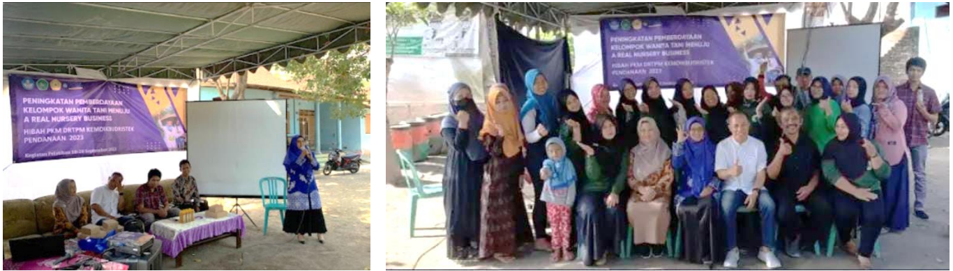
Gambar 3. Pelatihan Pemberdayaan KWT

Kegiatan selanjutnya adalah pelatihan yang dilakukan pada bulan September meliputi 3 pelatihan yaitu Pelatihan Pembudidayaan Pembibitan tanaman hortikultura, manajemen kebun bibit dan digital marketing.