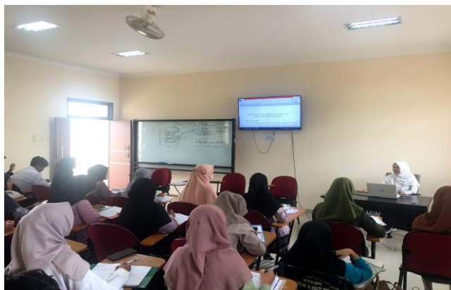
Gambar 1. Dokumentasi pelaksanaan kegiatan Pelatihan Menulis Sastra Anak Berbasis Kearifan Lokal Pada Mahasiswa PGMI IAIN Palangka Raya

Kegiatan pelatihan menulis sastra anak berbasis kearifan lokal memiliki 5 kali pertemuan. Pada pertemuan pertama pemateri memaparkan tentang menulis sastra anak berbasis kearifan lokal. Pada sesi pemaparan materi, diketahui bahwa tidak mudah bagi peserta untuk menghasilkan sebuah cerita. Kendala/kesulitan tersebut berasal dari diri peserta yang meliputi kurangnya pengetahuan dan pengalaman dalam menulis cerita. Keterampilan menulis dianggap sebagai keterampilan yang paling sulit dan rumit. Hurlock dalam (Rasyid et al. , 2019) menyebutkan bahwa menulis teks cerpen, sebagaimana karya kreatif lain, menuntut kemampuan penulis dalam menghasilkan komposisi atau gagasan yang pada dasarnya baru. Teks cerpen sebagai karya kreatif berupa kegiatan imajinatif atau sintesis pemikiran yang membentuk pola baru atau korelasi baru. Karya kreatif memiliki maksud dan tujuan, dan diciptakan dengan struktur yang relatif rumit [10].