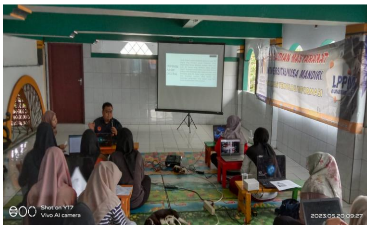
Gambar 1. Kegiatan Pemberian Materi Secara Luring

Kegiatan pengabdian masyarakat yang akan dilaksanakan adalah berupa pelatihan dengan tema “Pelatihan Pengelolaan Arsip Berbasis Digital Bagi Remaja Masjid Baitul Halim (RBH) Mampang Prapatan Jakarta Selatan”. Peserta terdiri dari Remaja Masjid Baitul Halim (RBH) dengan jumlah peserta sebanyak 20 orang. Kegiatan pengabdian masyarakat ini akan dilaksanakan pada hari sabtu tanggal 20 Mei 2023 pada pukul 09.00-12.00 WIB secara daring dan luring. Untuk yang berada dalam luring bertempat di Serambi Masjid Baitul Halim, Jl. KH. Marzuki Ishaq, Mampang Prapatan VII, Tegal Parang, Jakarta Selatan. Rt 006/006, Kode Pos 12790 untuk yang daring dengan menggunakan Zoom Meeting. Berikut merupakan beberapa dokumentasi kegiatan pengabdian masyarakat.