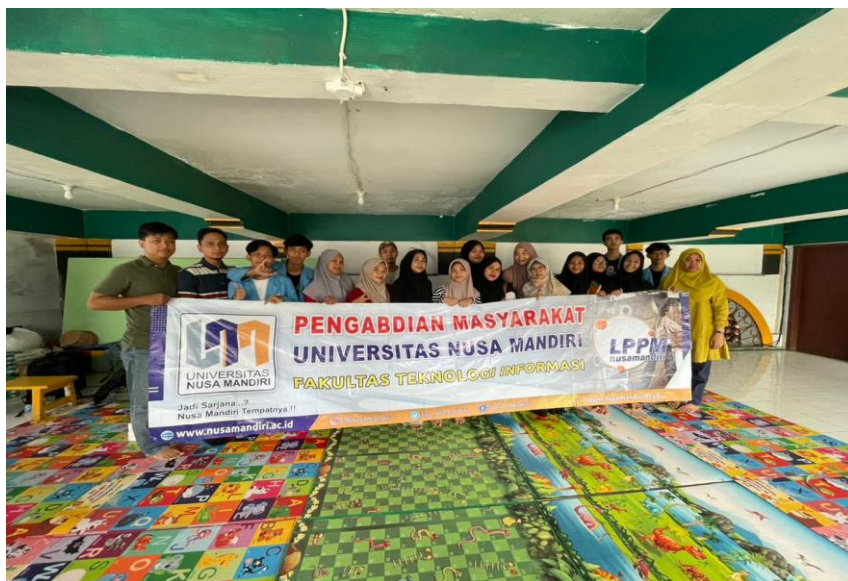
Gambar 4. Dokumentasi Kegiatan Pengabdian Masyarakat

Pada gambar 3 di atas dalam kegiatan pengabdian masyarakat ini turut melibatkan peran dari mahasiswa-mahasiswa Universitas Nusa Mandiri. Dengan adanya mahasiswa tersebut dapat membantu tutor jika ada peserta yang kurang paham atau tidak mengerti materi yang diberikan oleh tutor. Dan mahasiswa juga mendapatkan pengalaman dengan terlibat langsung dalam kegiatan pengabdian masyarakat.