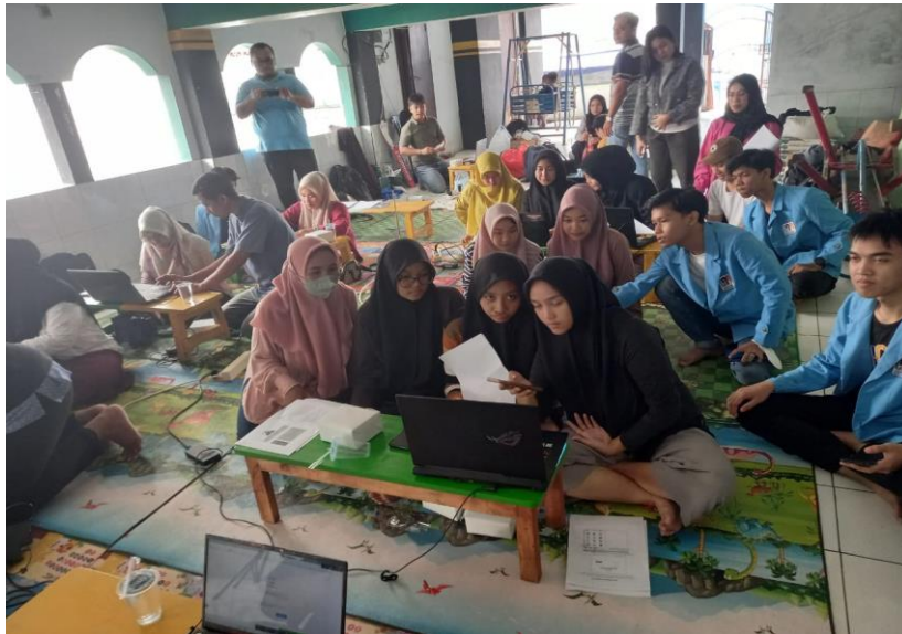
Gambar 3. Kegiatan Pemberian Materi Oleh Mahasiswa Universitas Nusa Mandiri

Pada gambar 3 di atas dalam kegiatan pengabdian masyarakat ini turut melibatkan peran dari mahasiswa-mahasiswa Universitas Nusa Mandiri. Dengan adanya mahasiswa tersebut dapat membantu tutor jika ada peserta yang kurang paham atau tidak mengerti materi yang diberikan oleh tutor. Dan mahasiswa juga mendapatkan pengalaman dengan terlibat langsung dalam kegiatan pengabdian masyarakat.