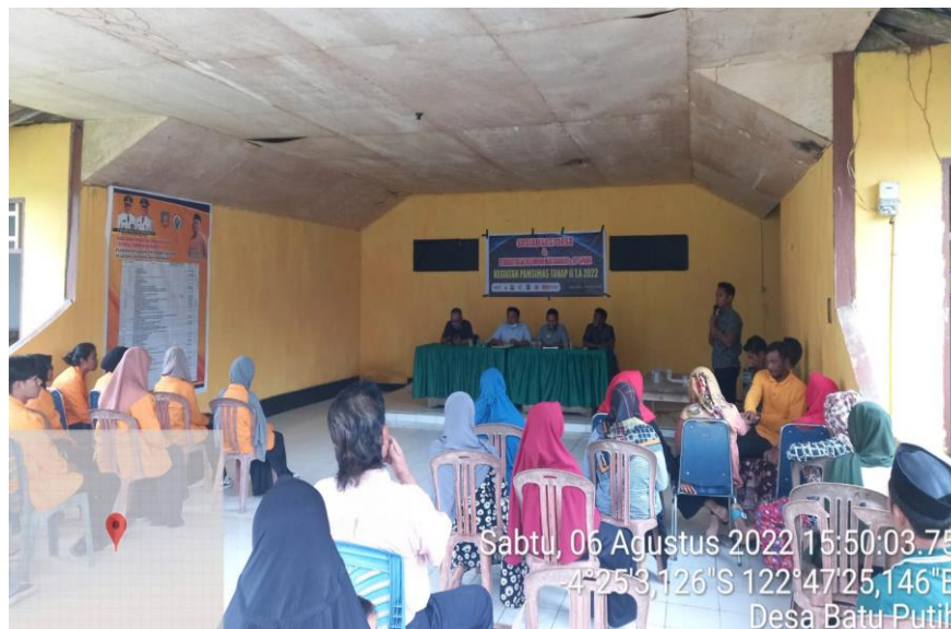
Gambar 2. Sosialisasi Kegiatan Program PAMSIMAS di Desa Batu Putih Kecamatan Kolono Timur Kabupaten Konawe Selatan

Sosialisasi merupakan tindakan yang merupakan bagian dari pelaksanaan program dan berpengaruh dalam menentukan keberhasilan program [5]. Melalui hasil pengumpulan data yang dilakukan diperoleh informasi bahwa pelaksanaan sosialisasi kepada masyarakat sebanyak satu sampai dua kali tergantung kepada kondisi kelurahan yang mendapatkan program. Sosialisasi yang diadakan tersebut dilakukan dengan harapan masyarakat mampu mengetahui gambaran umum dari program, memiliki pemahaman yang baik akan sarana air yang dibangun sehingga mempunyai rasa memiliki untuk memiliki sarana yang tersedia. Kebutuhan masyarakat akan Sanitasi dan air bersih harus menjadi perhatian utama baik oleh Pemerintah Pusat, daerah maupun Pemerintah Desa. Hal tersebut yang menjadi alasan dilaksanakannya sosialisasi Program penyediaan air minum dan sanitasi berbasis masyarakat (Pamsimas) di Desa Batu Putih Kecamatan Kolono Timur Kabupaten Konawe Selatan bertempat di Aula Kantor Desa. Tujuan sosialisasi tersebut adalah untuk menjelaskan pentingnya penggunaan dan pengelolaan Air bersih oleh masyarakat sekaligus meminta persetujuan warga untuk pelaksanaan Pamsimas Tahun Anggaran 2022 di Desa Batu Putih Kecamatan Kolono Timur Kabupaten Konawe Selatan. Sosialisasi diadakan di desa setempat sehingga mudah dijangkau dan melibatkan tokoh masyarakat setempat. Hal ini dilakukan dengan harapan bahwa masyarakat menjadi lebih aktif dan informasi yang disampaikan mudah dipahami.