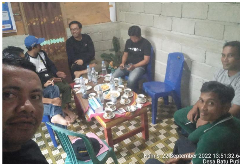
Gambar 4. Diskusi dengan Masyarakat Terkait Pelaksanaan Program PAMSIMAS di Desa Batu Putih Kecamatan Kolono Timur Kabupaten Konawe Selatan

Berdasarkan hasil diskusi dan informasi yang dilakukan terhadap masyarakat di Desa Batu Putih Kecamatan Kolono Timur partisipasi dalam bentuk sumbangan pikiran, keaktifan dalam berdiskusi rencana kegiatan Program PAMSIMAS, mayoritas masyarakat desa di Desa Batu Putih Kecamatan Kolono Timur menjawab memberikan usul rencana kegiatan yang akan dilakukan sesuai dengan partisipasi masyarakat dalam menyambut Program PAMSIMAS ini agar dapat dimanfaatkan oleh masyarakat Desa Batu Putih Kecamatan Kolono Timur. Berdasarkan hasil diskusi yang dilakukan terhadap masyarakat Desa Batu Putih Kecamatan Kolono Timur, menjawab paling banyak bentuk sumbangan pada saat pelaksanaan yaitu sumbangan berupa tenaga ( inkind ) dan uang ( incash ). Adapula masyarakat yang menjawab sumbangan dalam bentuk tenaga saja; tenaga, uang dan material; sumbangan berupa tenaga dan material serta sumbangan uang dan material sehingga dapat disimpulkan bahwa bentuk sumbangan paling banyak pada saat pelaksanaan kegiatan sumbangan tenaga ( inkind ) dan uang ( incash ). Setelah pelaksanaan pembangunan, perlu adanya partisipasi masyarakat dalam memanfaatkan apa yang telah dibangun sangat penting. Masyarakat akan merasakan manfaatnya langsung dan dapat memperbaiki kualitas mutu kehidupan mereka sehingga hasil pembangunan menjadi wujud yang nyata. Bentuk partisipasi setelah pelaksanaan pembangunan untuk memelihara yang telah dibangun di Desa Batu Putih Kecamatan Kolono Timur adalah uang.