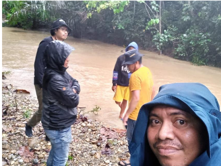
Gambar 3. Partisipasi Masyarakat Saat Mengecek Pembangunan Sarana Pamsimas

[6]. Kegiatan yang melibatkan partisipasi masyarakat pada tahap pelaksanaan adalah mengecek lokasi pembangunan sarana di Desa Batu Putih.